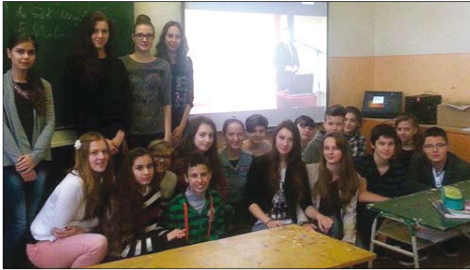
Iskolánk kiscsögisei, a kvartó osztály tanulói lelkesen szavaltak együtt a Kárpát-medence és a világ magyarjaival.

10 óra előtt pár perccel megnyitottuk az esemény YouTube csatornáját. Nem kellett sokat várnunk, hogy Jordán Tamás vezényletével elkezdődjön a gyakorlat, amelyhez energikus karmozdulatait adták az ütemet. Idén az esemény fő központja Orosháza volt, ahol egy teremnyi diák szavalt együtt mindazokkal, akik az internet segítségével bekapcsolódtak a közös