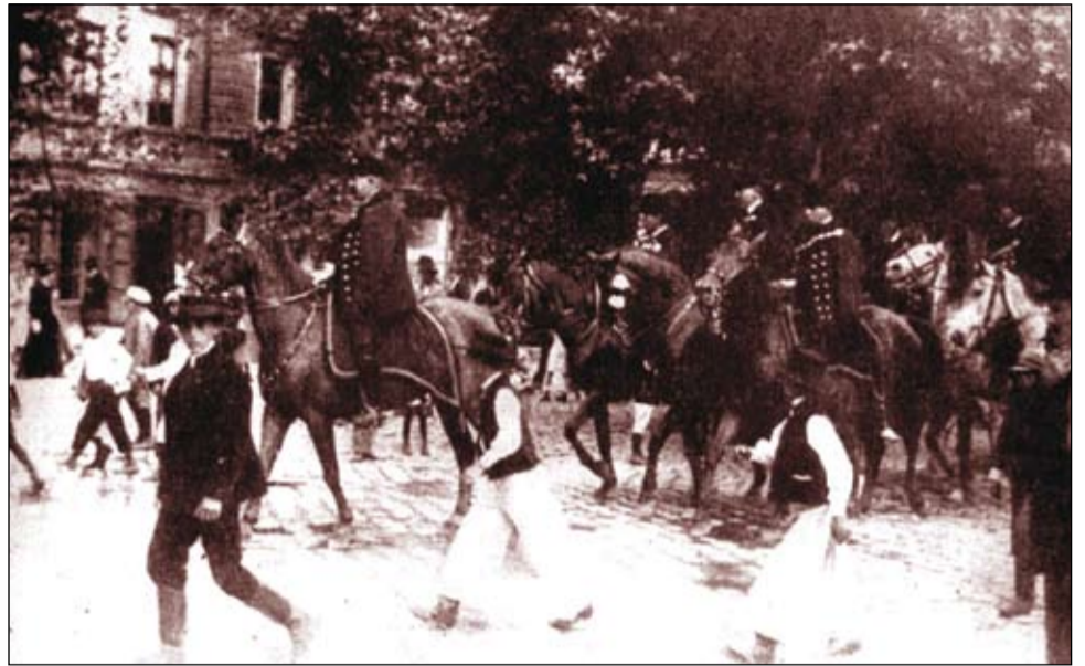
A bandérium felvonulása 1922-ben