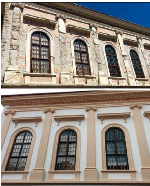
Felvételünkön a megyeháza régi, illetve a szépen felújított homlokzata

„Hosszú évekig nem kaptak elég figyelmet az épített örökségeink, de az elmúlt években sikerült végre elindítani több folyamatot. Az erőd kaszárnya-épületének tetőszerkezete megújult, a Megyeháza már második éve szépül és remélhetőleg folytatódik, de a Tiszti Pávilon kihasználatlan részein is fontos felújítások voltak” – fejtette ki Stubendek László polgármester. „Sok még a tennivaló, sajnos nagyon elhanyagolták a