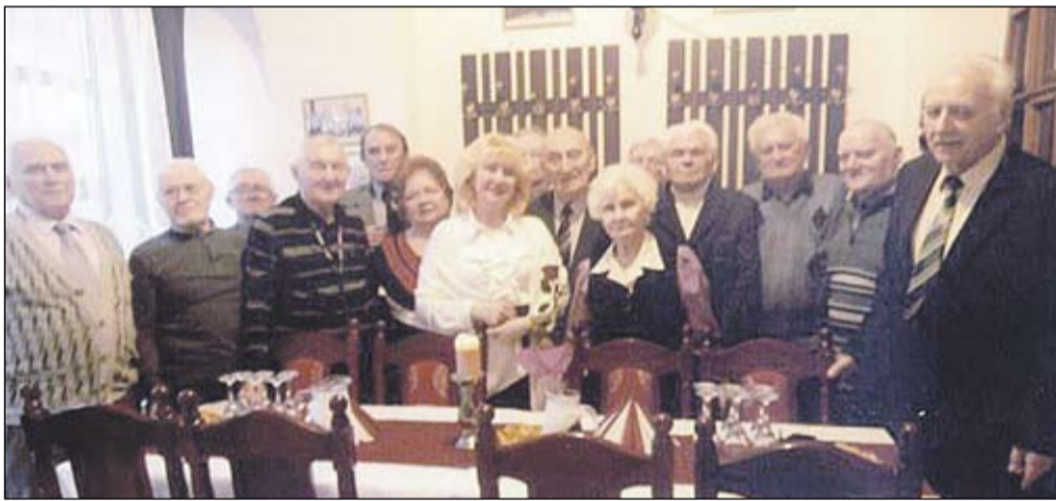
Az emlékszoba avató ünnepség résztvevői

A megalapításának 25. évfordulóját ünneplő Klapka Vigadó egyik helyiségében ünnepélyes keretek közt emlékszobát nyitottak a 40 éves komáromi nyugdíjas klub mellett működő, s a megalakulásának 15. évfordulóját ünneplő Klapka György nevét viselő férfi dalkörnek.