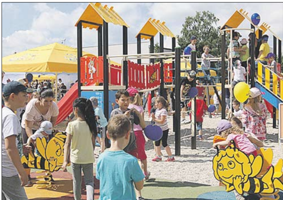
A komáromi lakosok példás összefogásának köszönhetően ilyen játszótér épül hamarosan városunkban