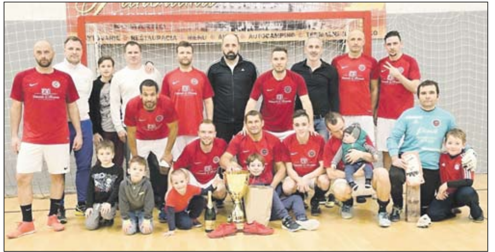
A városi teremlabdarúgó bajnokság győztese, a Bauring City csapata

Megismétlődött a tavalyi év forгатókönyve, egy évvel korábban is óriási csatát vívott ez a két gárda a döntőben, és drámai végjáték után a Bauring City legénysége tovább bővíthette korábban szerzett tróféái számát. Menet közben az ideai bajnoki sorozatban is kiderült, hogy ismét ez a két együttes alkotja a legerősebb egységet. A telt lelátó előtt ismét drámai nagy csatában, ráadásul csak hosszabbítás után dőlt el ki lesz a bajnok. 0:0-ás félidő után a második játékrészben a