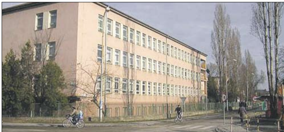
A város idén elsődlegesen a Jókai Mór Alapiskola és a Komensky utcai alapiskola épületeinek hőszigetelésére szándékozik pályázni