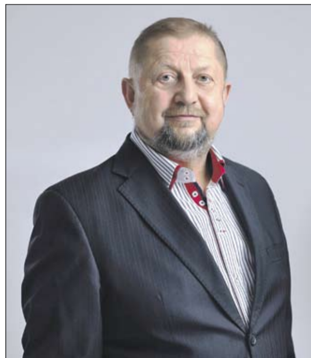
JUDr. Štefan Harabin občiansky kandidát na prezidenta SR

Som za to, aby Slovenská republika zostala v Európskej únii, ale ako rovnoprávny člen. Európska únia je projekt, ktorý má slúžiť členským štátom. No postupne sa mení na diktatúru jediného dovoleného názoru z Bruselu, na diktatúru zákazov, príkazov a nariadení, a to aj v otázkach, ktoré sú výlučne v kompetencii členských štátov. Európska únia sa musí vrátiť k svojmu pôvodnému cieľu, čo je hospodárska spolupráca. Ak sa nezmení politika Európskej únie, tak sa nezmení ani môj názor, hoci budem vo funkcii prezidenta.